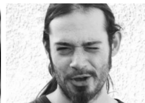
Anthony Valère PLATEAU/CONCEPTION Scénographe