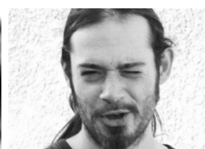
Anthony Valère PLATEAU/CONCEPTION Scénographe